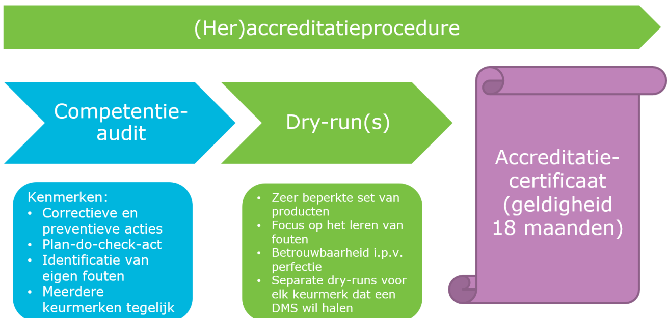
Figuur 1: (Her)accreditatieprocedure

Dry-run(s) - hierin wordt met een simulatie gekeken of een DMS gegevens daadwerkelijk goed kan vastleggen en/of kan controleren, en of de organisatie in staat is om via het kwaliteitsmanagementsysteem terugkoppeling te gebruiken om kwalitatieve verbeteringen toe te passen in haar processen (zie hoofdstuk 5 dry-runs).